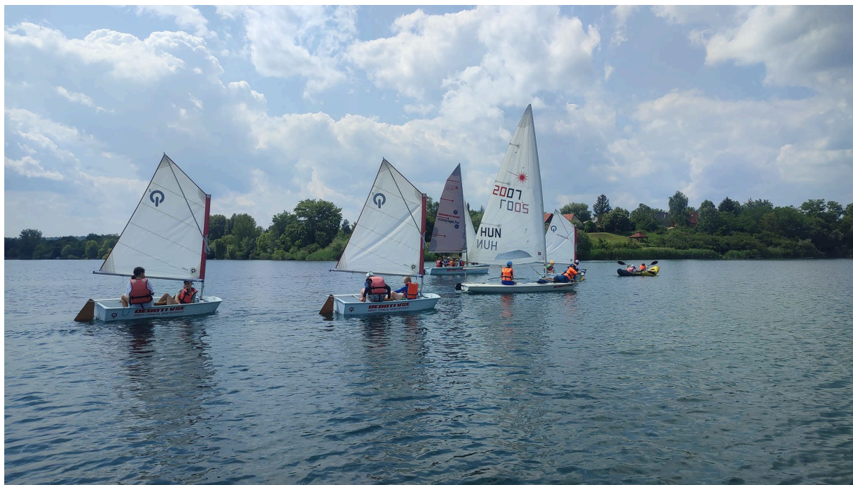
3. ábra: tőkesúly nélküli vitorlás csónak