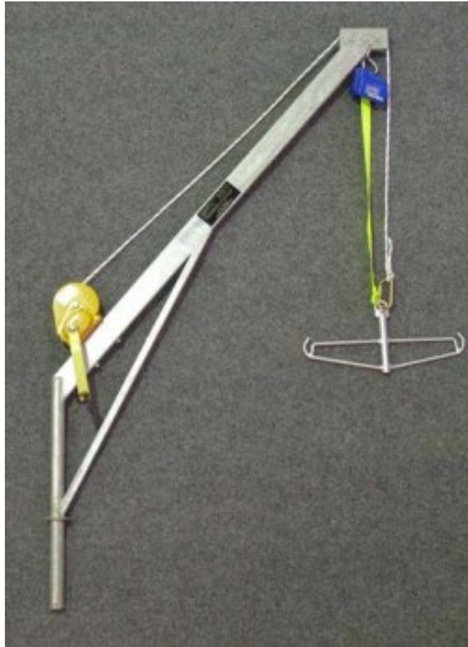
4. ábra Mozgássérültek vízre jutását elősegítő eszköz („daru”)