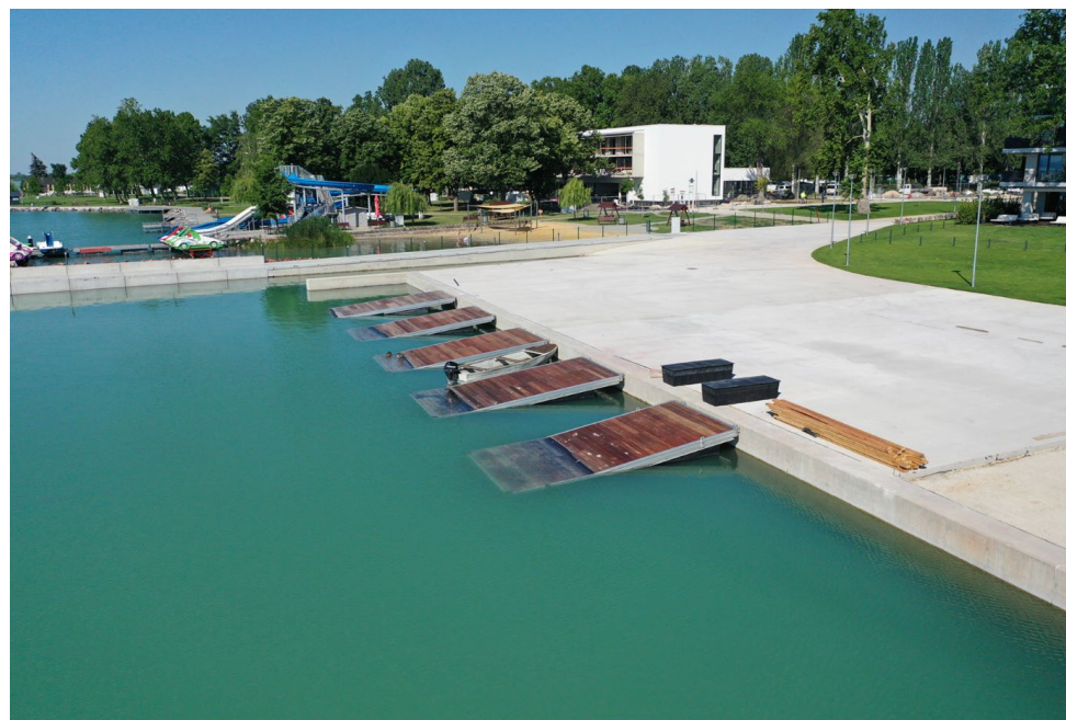
1. ábra: merülő sólya fotó

A vitorlás csónak vízre tételéhez és kivételéhez a legalkalmasabb merülő sólya beszerzése. A pályázatban 2 megállópontra kerül kialakításra merülő sólya. Egy megállópontra mozgássérültek vízre jutását elősegítő eszköz („daru”) kerül telepítésre, mely egyszerű, könnyen kezelhető és biztonságos. A megállópontokon kényelmi és higiéniai infrastruktúra fejlesztése valósul meg, melyhez műszaki tervdokumentáció az 1. mérföldkő eléréséig kerül véglegesítésre. Az alábbi fotók bemutatják a fejlesztés főbb elemeit.